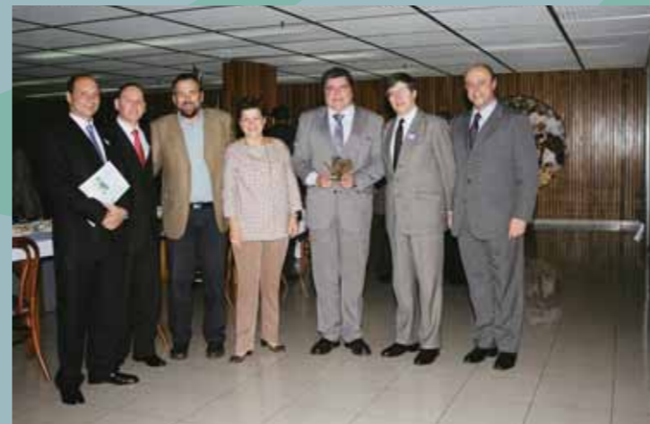
Empresários com o coordenador da Frente em reunião do GT de Empresas