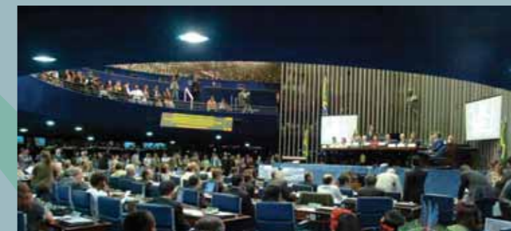
O Plenário e as galerias do Senado ficaram lotadas durante a Vigília