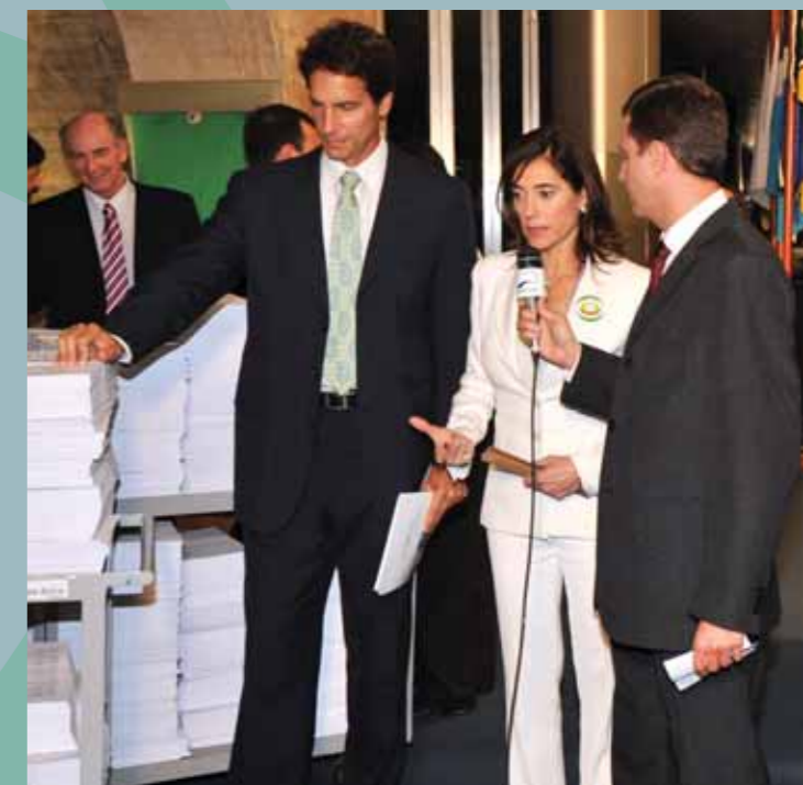
Cristiane Torloni e Victor Fasano entregaram aos parlamentares a Carta Manifesto em defesa da Amazônia