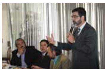
Movimento foi lançado em Brasília

"Acreditamos que o trabalho da Frente Parlamentar Ambientalista é mais uma contribuição da Câmara Municipal de Fortaleza para a construção de uma cidade ecologicamente sustentável e socialmente justa, no contexto maior de