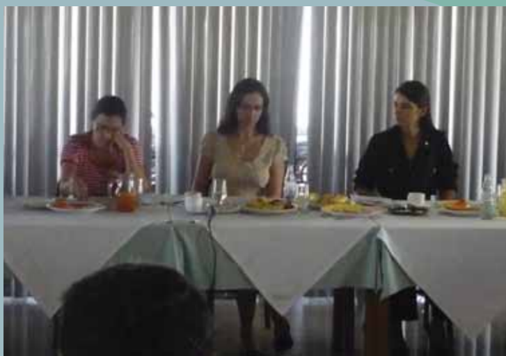
Ação Pró-Resex para cobrar a criação das UCs paralisadas na Casa Civil