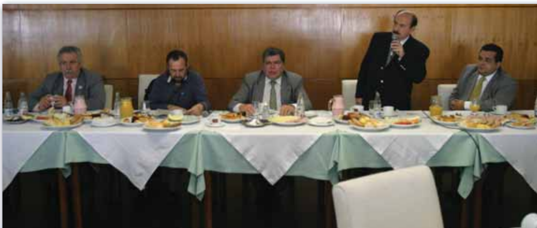
Presidente do CNTUR apresentou propostas para compatibilizar turismo com a preservação ambiental