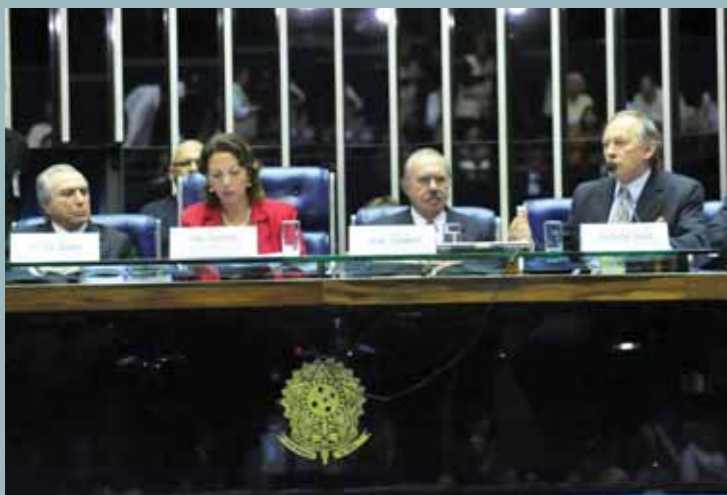
Vigília da Amazônia no Senado reuniu parlamentares, autoridades e ONGs