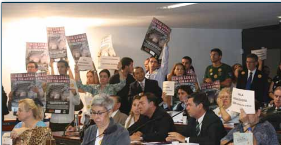
Manifestantes ocupam a Comissão de Educação em defesa dos animais

“Vivemos uma intensa evolução cultural e a população brasileira já percebeu essa mudança. Neste momento é necessário valorizar os artistas circenses e proibir, de uma vez por todas, a utilização de qualquer espécie em espetáculos”.