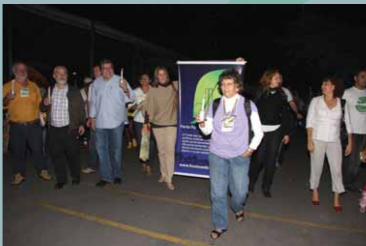
Manifestação contra as ameaças ao Código Florestal no evento Viva a Mata em São Paulo