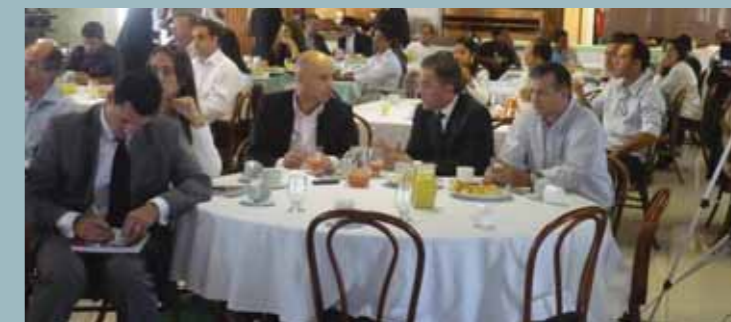
Evento da Frente no Dia Mundial da Água