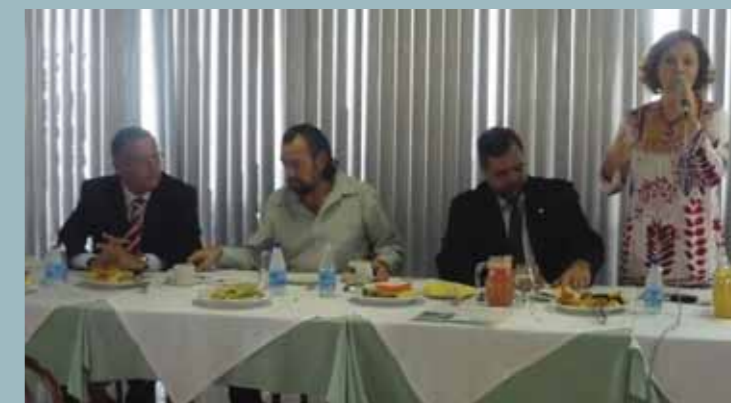
Frente discute os 10 anos da Lei de Educação Ambiental